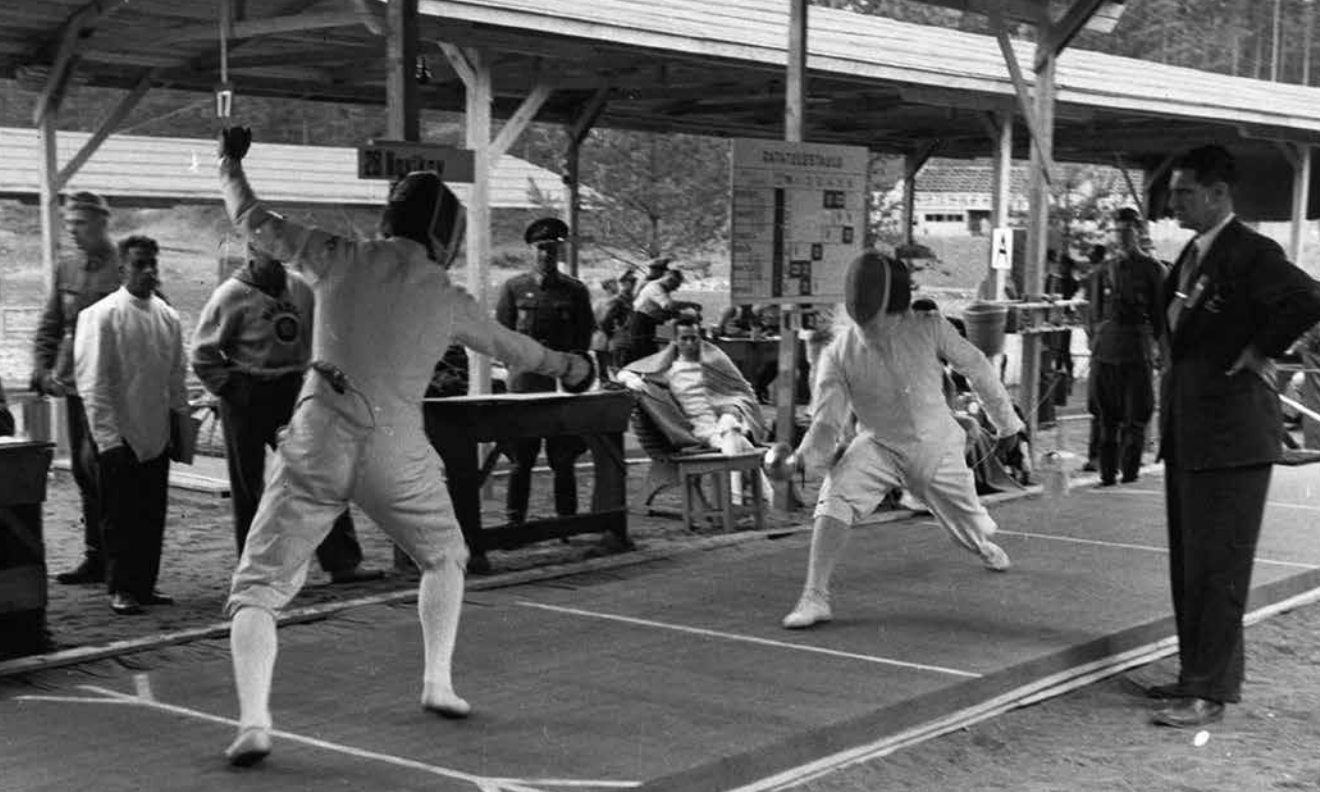
Hämeenlinnan olympiaviisiottelun miekkailu järjestettiin Ahvenistolla tilapäisillä katetuilla radoilla.