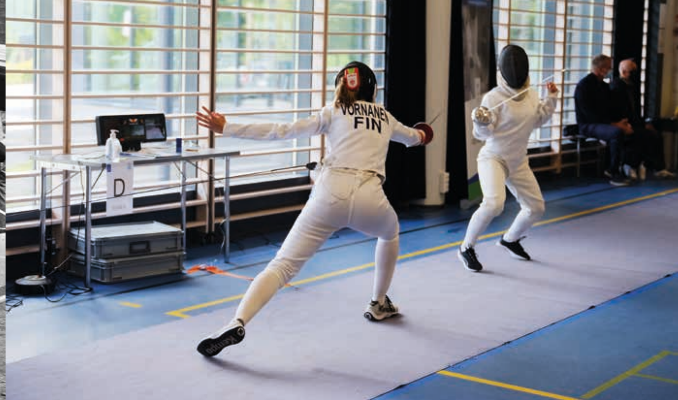
Monista sääntömuutoksista huolimatta miekkailu on säilyttänyt perinteisen perusluonteensa.