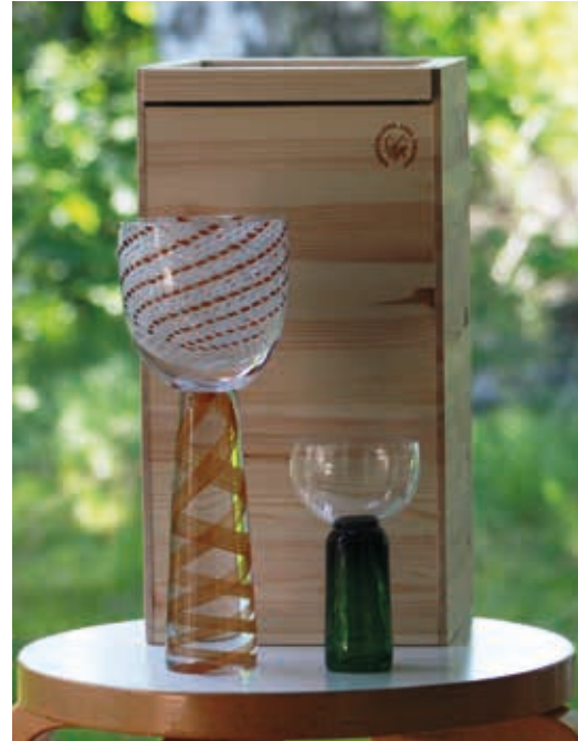
Pentathlon Hämeenlinna 1952 Trophy -lasipokaali on Iittalan lasitehtaan ja Tavastian opiskelijoiden käsialaa.